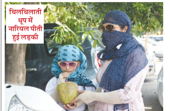
चिलचिलाती धूप में नारियल पीती हुई लड़की

लुधियाना / यूटर्न / 29 अप्रैल। गर्मी के बढ़ते प्रकोप को देखकर कर शुक्रवार को पंजाब सरकार ने स्कूलों के समय सारिणी में बड़े परिवर्तन की घोषणा की है। सभी सरकारी व प्राइवेट स्कूलों में 2 से 14 मई तक प्राइमरी कक्षा के लिए सुबह 7 से 11 बजे तक स्कूल लगेंगे। जबकि अन्य कक्षाओं के लिए दोपहर 12.30 बजे तक स्कूल खुलेंगे वहीं 15 मई से 30 जून तक छुट्टियों की घोषणा कर दी गई है। जबकि 16 मई से 31 मई तक आनलाइन क्लासेस लगाए जाने का भी प्रावधान है।